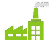
Site Industriel & Collectivité