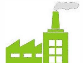
Site Industriel & Collectivité