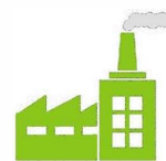
Site Industriel & Collectivité