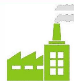
Site Industriel & Collectivité