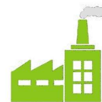
Site Industriel & Collectivité