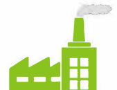
Site Industriel & Collectivité